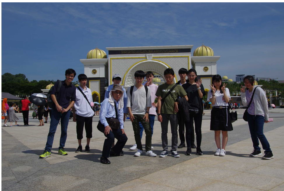
修学旅行（マレーシア・新モスク）