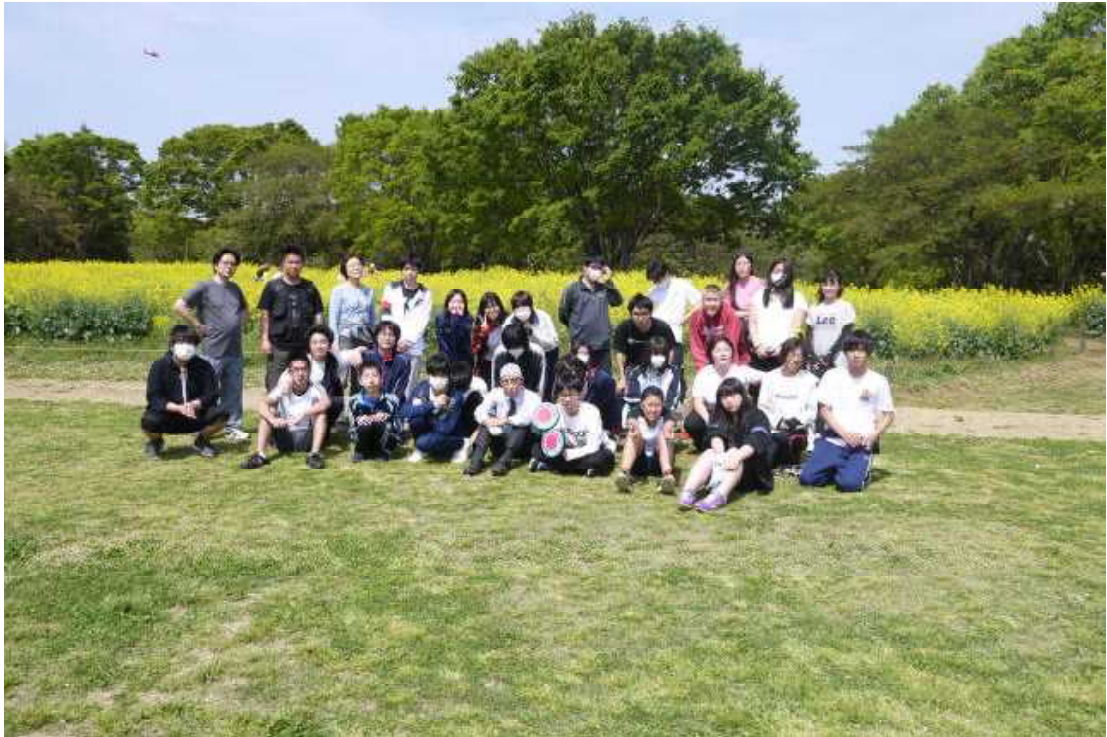
オリエンテーリング（昭和記念公園）